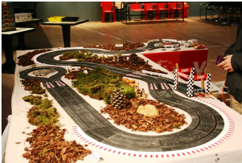
La PS 4