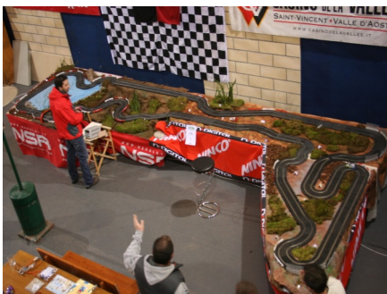
La PS 1

Alla seconda tappa, denominata "Vulpelliere", del 3° campionato del Gran San Bernardo rally slot club tenutasi ad Etroubles presso il bar Tennis, si sono dati appuntamento 15 piloti per aggiudicarsi i punti in palio per la classifica generale. La tappa, che ha avuto come fondo stradale l'asfalto