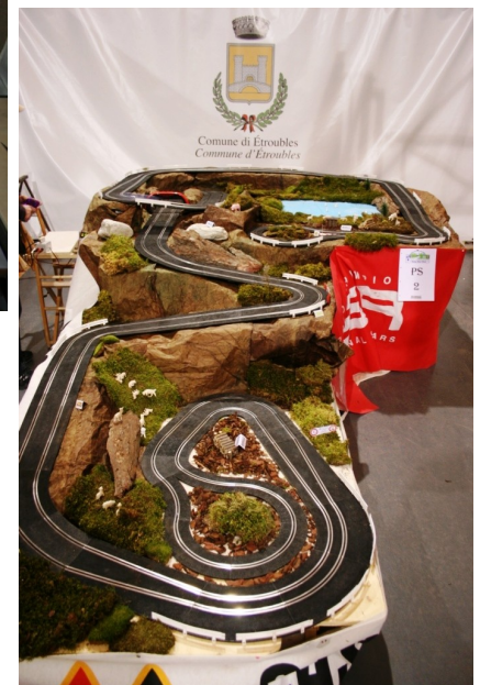
La PS 2