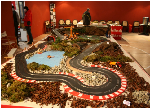
La PS 3