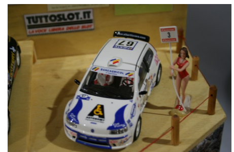
IKC sul podio